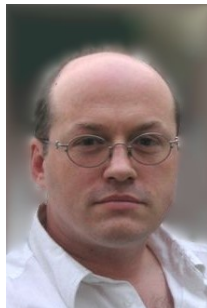
Dir. Claus Großkopf